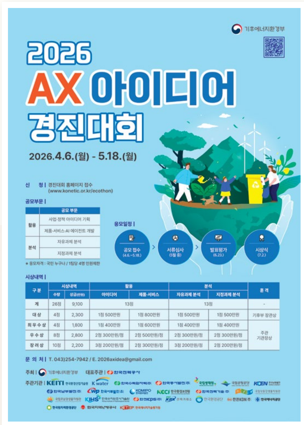
2026년도 AX 아이디어 경진대회 포스터